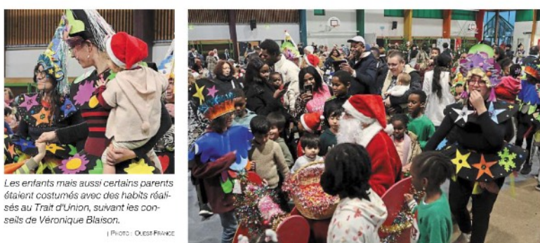
Positionné sur un train, le Père Noël a fait sensation jusqu'à devoir faire trois fois le tour de la salle, au rythme des chants de Noël.